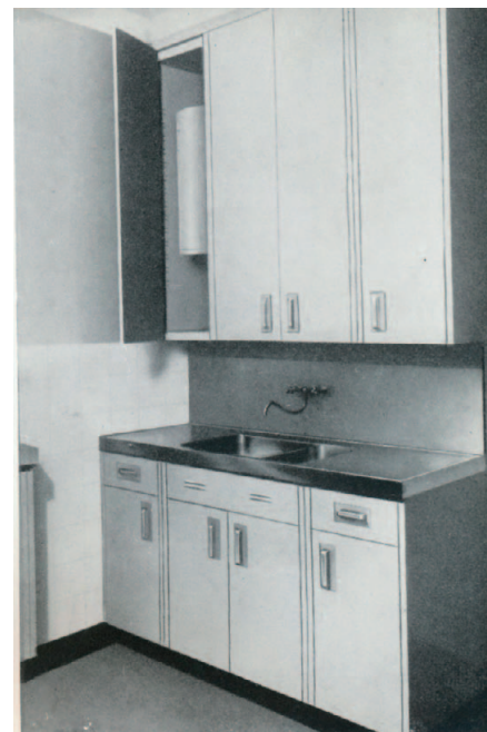
Francia kísérlet a konyha szabványosítására, beépített mosogatóval, vízmelegítővel, 1948

telepítve sok fiókkal, rakodásra alkalmas polcokkal. A fűszerektől az evőeszközökön át a szemetesládáig, minden fontos konyhai kelléknek megtervezte a helyét, a konyha közepébe pedig egy forgószeletet tett, hogy ülve lehessen szinte mindent elvégezni. Ez a mustársárgára festett és kék színnel dekorált konyha rekonstruáltan ma a bécsi Iparművészeti Múzeum egyik