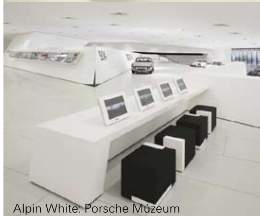
Alpin White: Porsche Múzeum