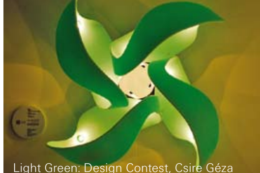
Light Green: Design Contest, Csire Géza