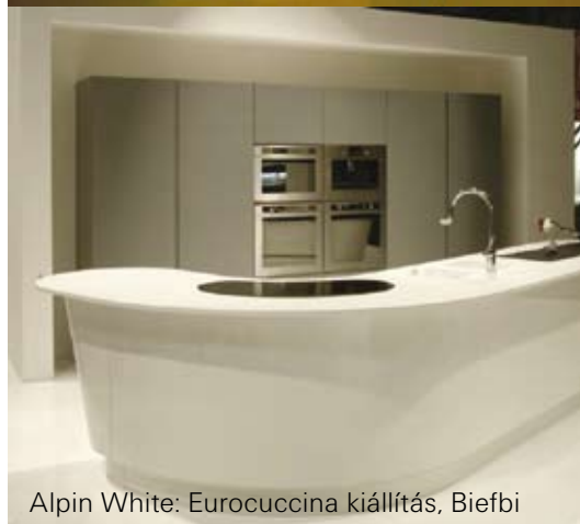
Alpin White: Eurocuccina kiállítás, Biefbi