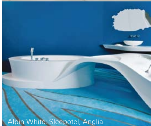
Alpin White: Sleepotel, Anglia